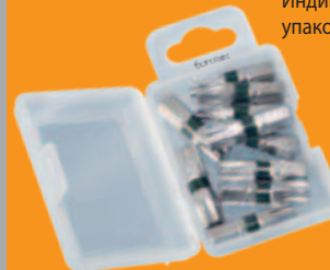
Упаковка насадок по 10 штук каждого размера