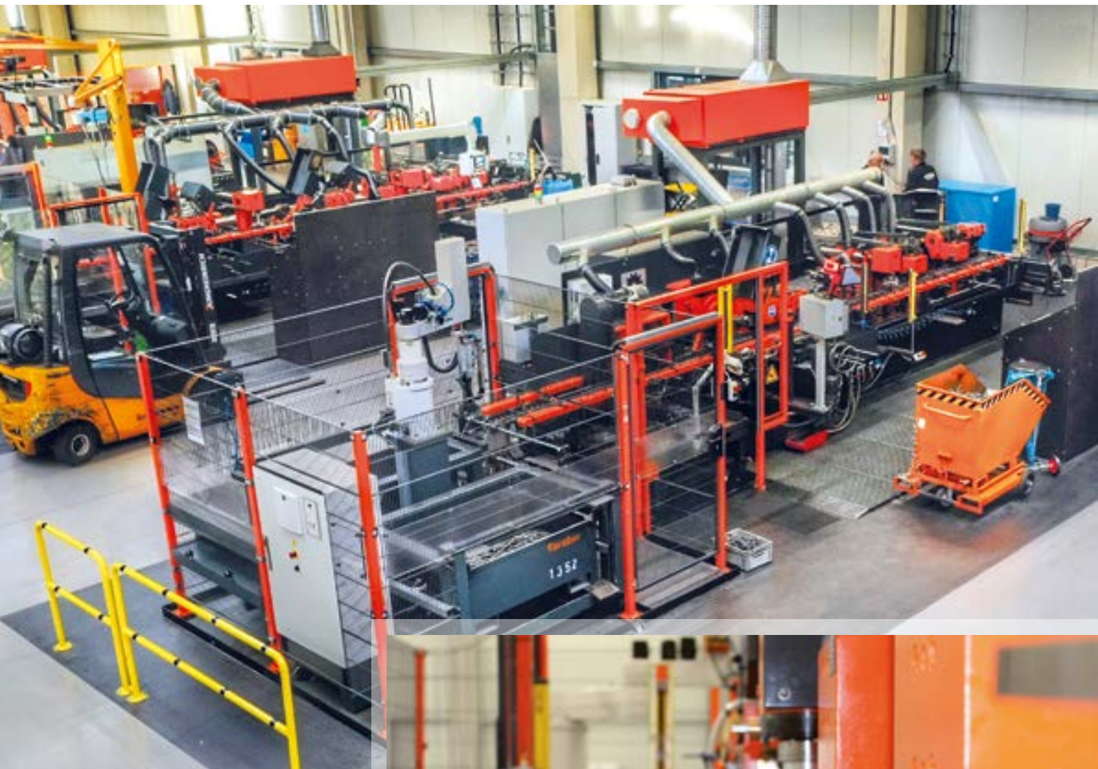
Formowanie na zimno